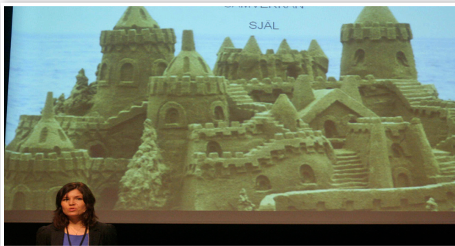
Mia Wahlström, Tyréns

Mia Wahlström från Tyréns redogjorde för en analys av tio framgångsrika storstäder runt om i världen. Intervjuer med politiker, planerare, trendsättare och andra har lett fram till bilden av Våra drömmars stad, där fyra faktorer är framträdande.