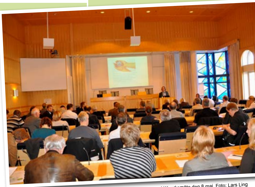
Nätverksmöte den 8 maj.

Nätverket består av medlemmar som tillhör alla länkar i byggkedjan. Visionen är att Umeåregionen ska vara ledande i världen för hållbart byggande och förvaltande i kallt klimat år 2020. Medlemmarna ska tillsammans förverkliga visionen genom att till exempel utbyta kunskap, göra egna och gemensamma satsningar, skapa en marknad i regionen och via avsiktsförklaringar driva utvecklingen framåt inom området.